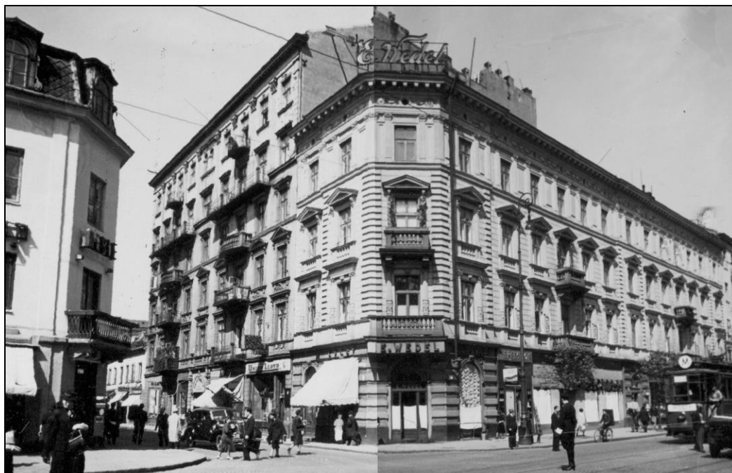
Warszawa, Chmielna 44 Zarząd Miejski, Wydział Planowania Miasta. 4.VI.1938r Seksja Planowania, Referat Gabarytów.