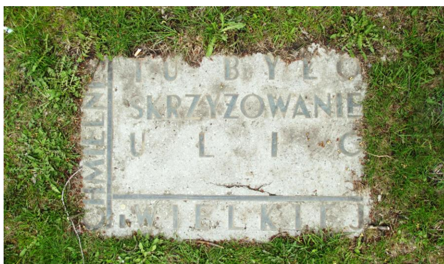
Tabliczka upamiętniająca skrzyżowanie ulic Chmielnej i Wielkiej