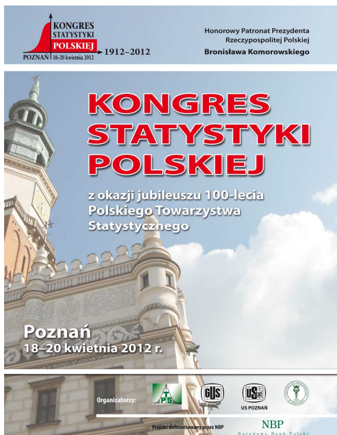
Plakat reklamujący Kongres Statystyki Polskiej