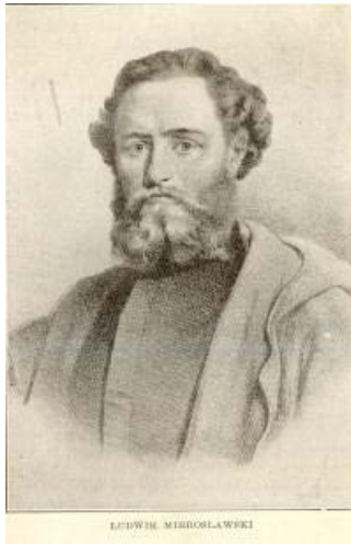
■ gen. Ludwik Mierosławski