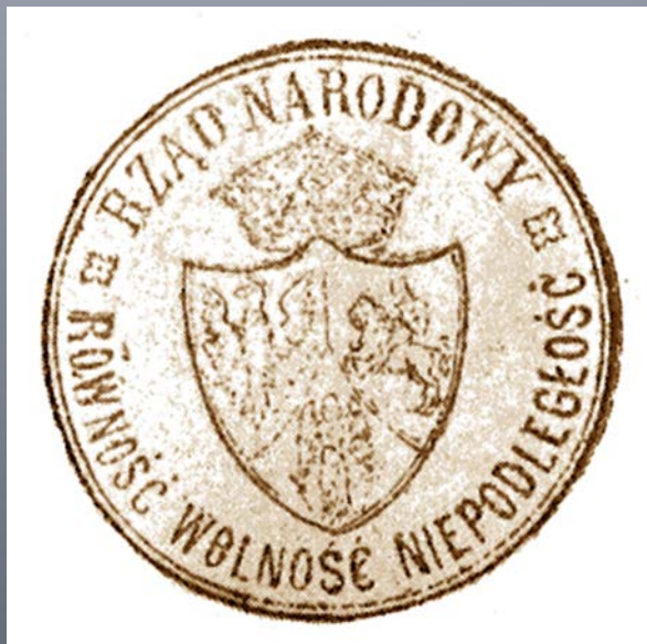
Pieczeń Rządu Narodowego