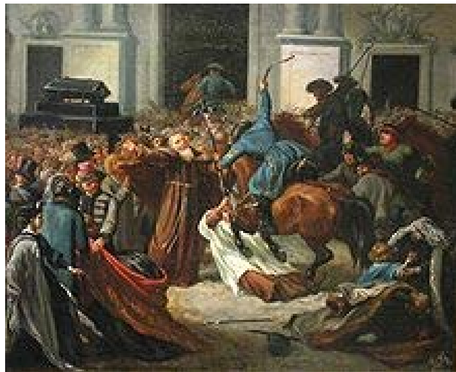
Kozacy atakują kościół św. Anny w Warszawie (1861)

Polacy liczyli, że car po przegranej wojnie krymskiej okaże się słaby i uległy. Coraz częściej na ulicach Warszawy odbywały się manifestacje patriotyczne z okazji rocznic narodowych lub ku czci sławnych Polaków. W kościołach zamawiano msze za Ojczyznę.