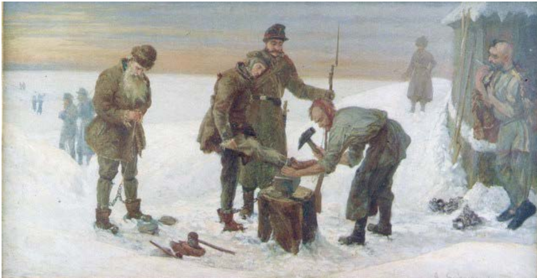
Obraz Al. Sochaczewskiego