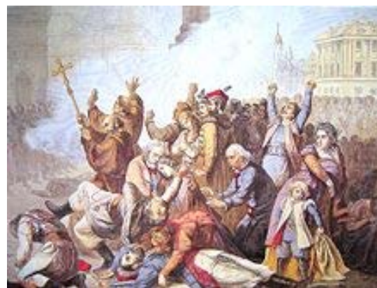
Wojsko rosyjskie strzela do manifestantów (1861)