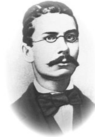
gen. Romuald Traugutt (1826-1864)

Ostatni - wybitny - dyktator powstania, stracony na stokach Cytadeli warszawskiej