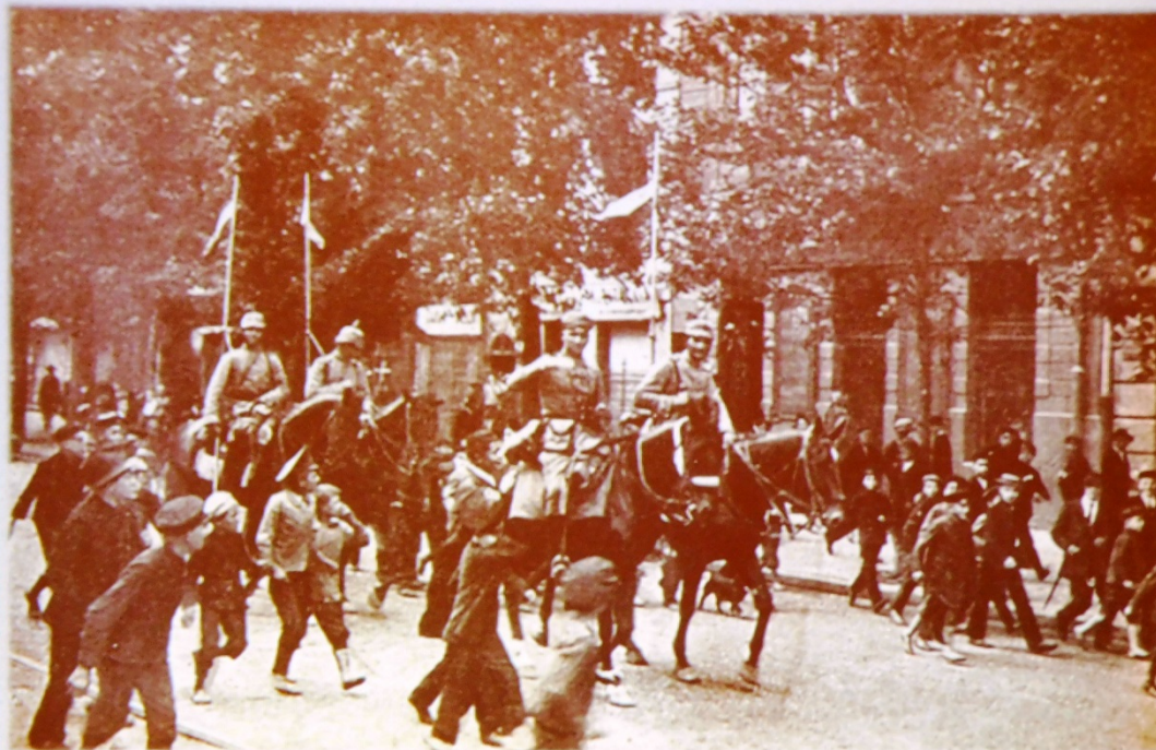
Ranek 5 sierpnia 1915

Wkraczają pierwsze oddziały armii cesarskich Niemiec do Warszawy