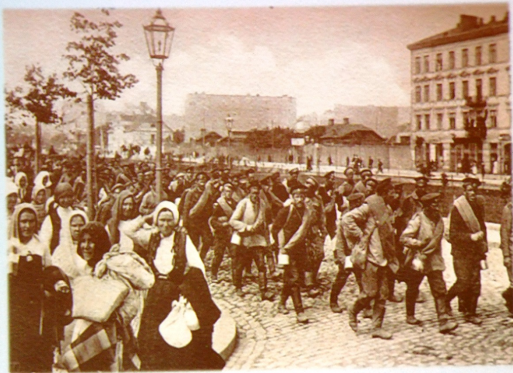
Wymarsz żołnierzy na Pradze

Po 123 letniej niewoli - opuszczają nas Rosjanie z 4 na 5 sierpnia 1915