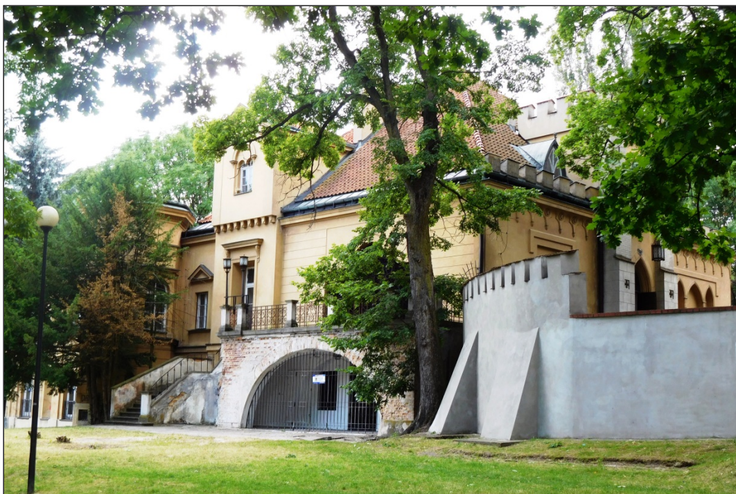
Pałacyk Szustra.