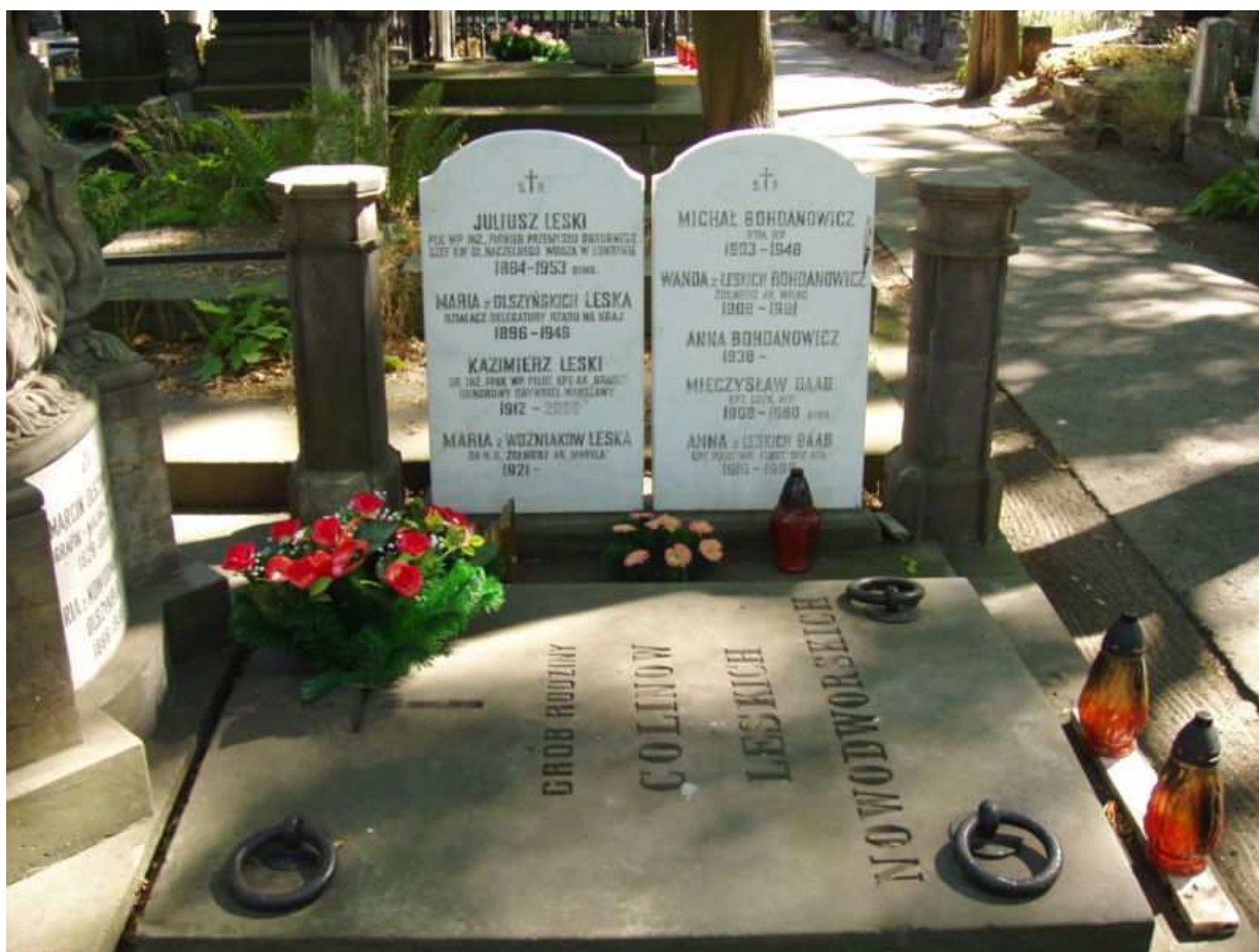
Grób rodziny Leskich na warszawskich Powązkach.