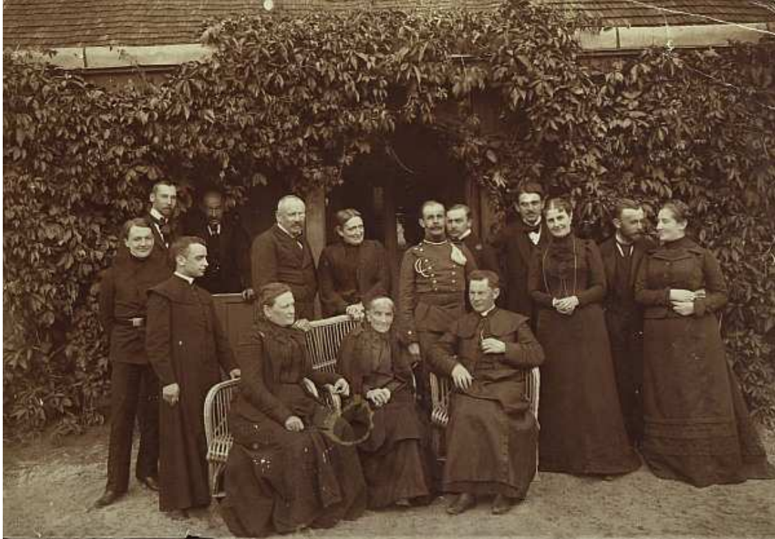
Spotkanie rodzinne w Milejowie w 1902 r.

Zebranie Komisji Historycznej TPW 12 lutego 2010 odbyło się wyjątkowo w drugi piątek miesiąca, w nietypowym miejscu: w Bibliotece Rolniczej na Krakowskim Przedmieściu, gdzie trwa wystawa poświęcona historii rodziny Rostworowskich.