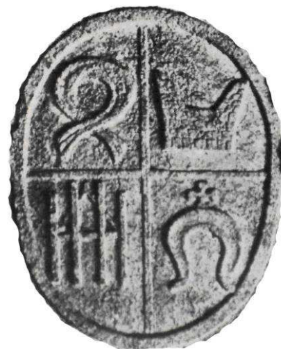
Fragment herbu rodziny Rostworowskich umieszczonego na murze uniwersytetu w Padwie (XVI w.)

Tematem naszego spotkania na wystawie były związki rodziny Rostworowskich z Warszawą, to też nasz przewodnik opowiadał