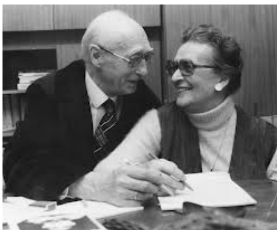
Alina i Czesław Centkiewiczowie